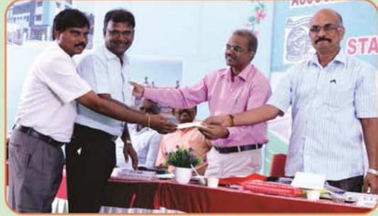
Cuddalore & Villupuram Branch