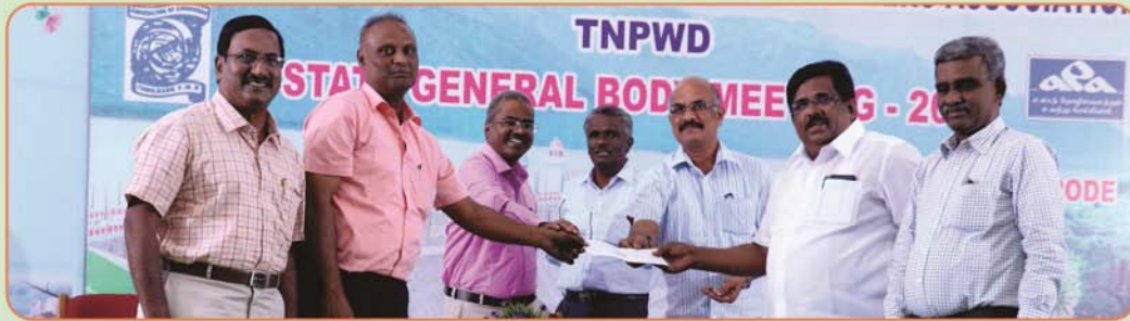
Rs.1 Lakh Building fund to Coimbatore Branch