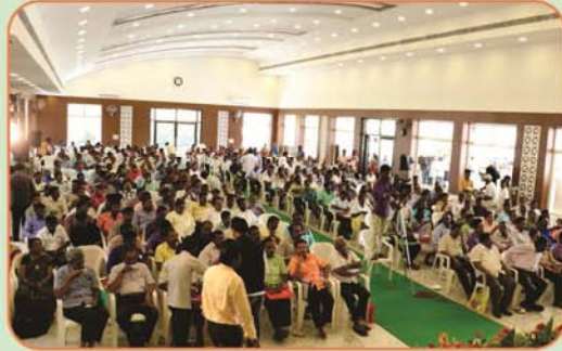
Gathering of General Body Meeting at Erode