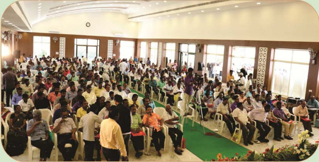
Gathering of General Body Meeting at Erode

Printed by : Mr.S.G.PARTHASARATHY, and Published by : Er.C.BALAMURUGAN, M.E., PGDFE., on behalf of Association of Engineers, PWD from Association of Engineers, PWD, PWD Campus, Chepauk, Chennai - 5, and Printed at : V.P.S. Printers, 292, Triplicane High Road, Triplicane, Chennai - 5, and Published at Association of Engineers, PWD, PWD Campus, Chepauk, Chennai - 5, Editor : Er.K.ANBU, M.E.,