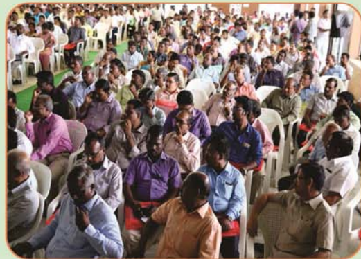
Gathering of General Body Meeting at Erode