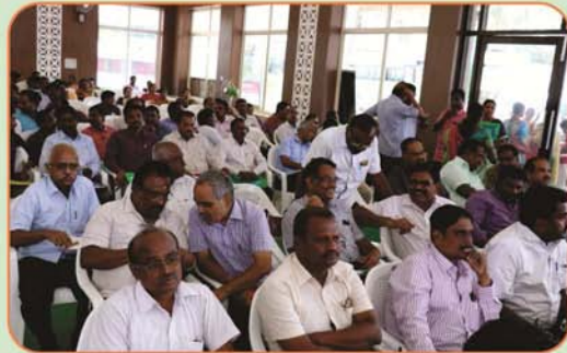
Gathering of General Body Meeting at Erode