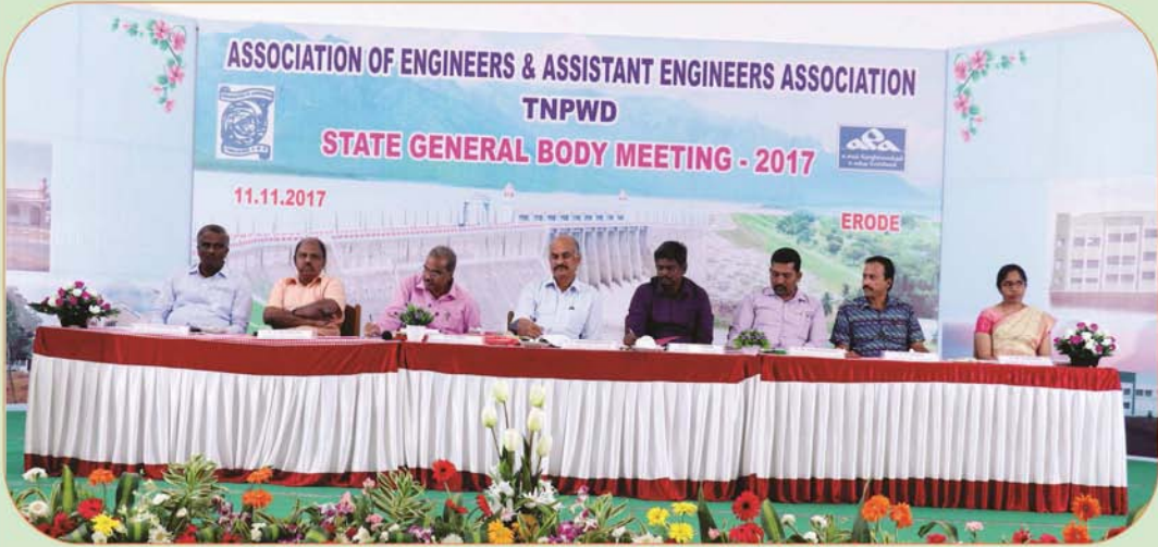
Annual General body Meeting AOE & AEA at Erode

PORIYALAR, Egmore RMS / 1 Patrika, Chennai Reg. No.T.N. / CH (C) / 307 / 15 - 17 Posted on : 22.11.2017, Licensed to Post without prepayment under WPP No.TN/PMG(CCR), WPP No.340/15-17