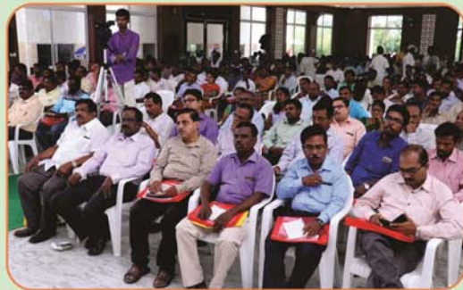
Gathering of General Body Meeting at Erode