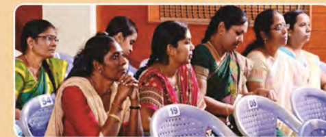
Views of Gathering