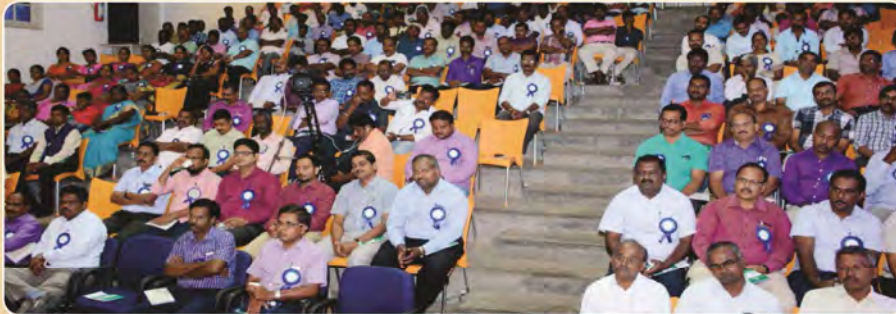
Views of Gathering