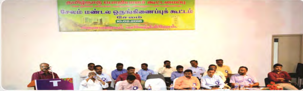
10.02.2018 அன்று தமிழ்நாடு பொறியாளர் கூட்டமைப்பின் சார்பாக செலத்தில் நடைபெற்ற மண்டல ஒருங்கிணைப்பு கூட்டம்