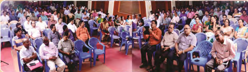
Views of Gathering