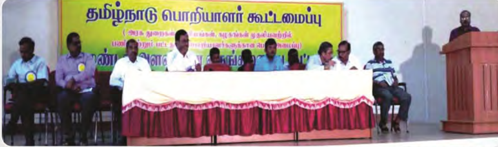
21.01.2018 அன்று தமிழ்நாடு பொறியாளர் கூட்டமைப்பின் சார்பாக கோயம்புத்தூரில் நடைபெற்ற மண்டல ஒருங்கிணைப்பு கூட்டம்

PORIYALAR, Egmore RMS / 1 Patrika, Chennai Reg. No.T.N. / CH (C) / 307 / 18 - 20 Posted on : 22.02.2018, Licensed to Post without prepayment under WPP No.TN/PMG(CCR), WPP No.340/18-20