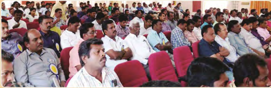
Views of Gathering