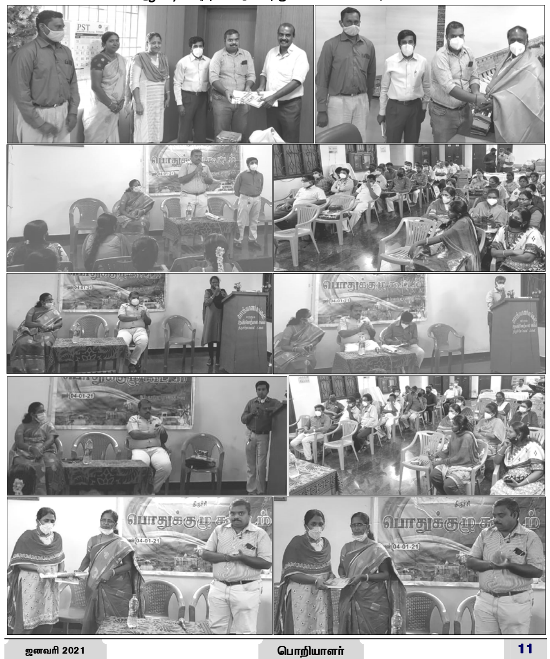
பொறியாளர் சங்கம் மற்றும் உதவிப் பொறியாளர் சங்கம், திருச்சி கிளையின் சார்பாக நடைபெற்ற 2021-ம் ஆண்டின் புத்தாண்டு கலந்துரையாடல் கூட்ட புகைப்படங்கள்