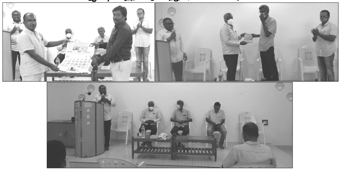
பொறியாளர் சங்கம் மற்றும் உதவிப் பொறியாளர் சங்கம், திண்டுக்கல் கிளையின் சார்பாக நடைபெற்ற 2021-ம் ஆண்டின் புத்தாண்டு கலந்துரையாடல் கூட்ட புகைப்படங்கள்