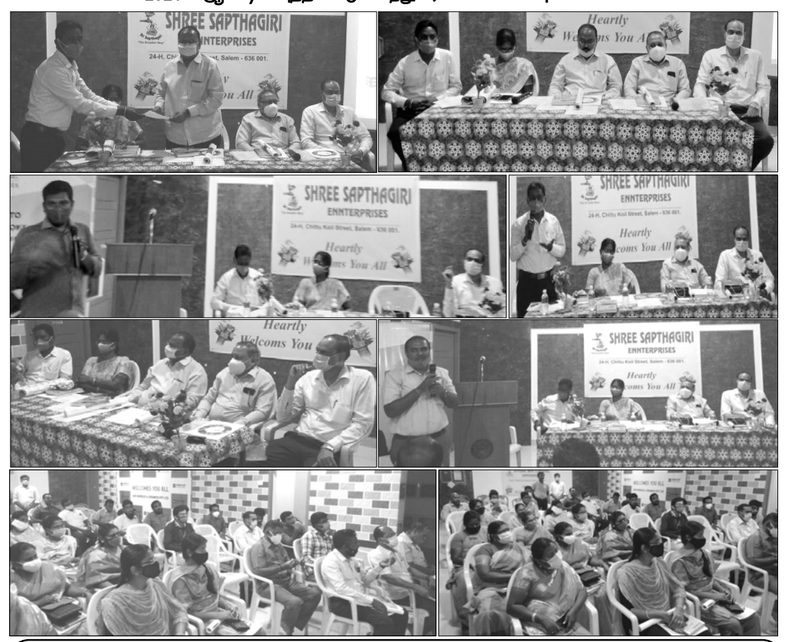
பொறியாளர் சங்கம் மற்றும் உதவிப் பொறியாளர் சங்கம், சேலம் கிளையின் சார்பாக நடைபெற்ற 2021-ம் ஆண்டின் புத்தாண்டு கலந்துரையாடல் கூட்ட புகைப்படங்கள்

நன்றியும்.. பாராட்டும்.. ஆண்டின் சங்கக்கின் 2021-ஆம் _ தொகையினை முழுமையாக (55 உறுப்பினர்கள்) வருடத்தின் துவக்கத்திலேயே (02.01.2021) செலுத்திய வேலூர் கிளைச் பொறுப்பாளர்களுக்கும், சங்கத்தின் உறுப்பினர்களுக்கும் தலைமைச் சங்கப் கிளைச் சங்கத்தின் சார்பில் நன்றியினையும், நெஞ்சார்ந்த பாராட்டுதல்களையும் தெரிவித்துக்கொள்கிறோம்.